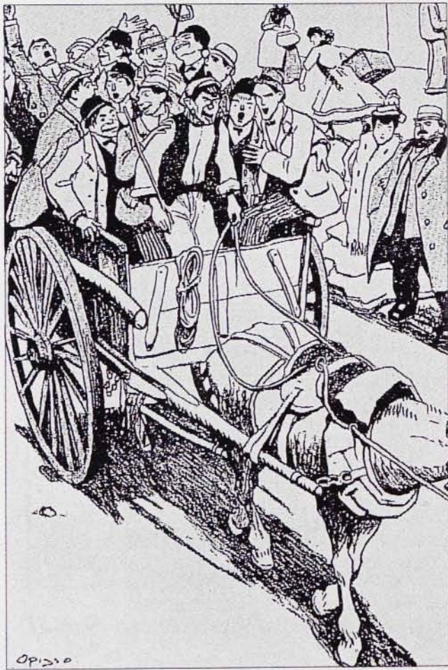
Dibuix d'Opisso: trasllat dels estudiants de Mediciona del carrer del Carme a la nova Facultat del carrer de Casanova, 1906.