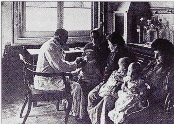
Dispensari de vacunació del Laboratori Microbiològic Municipal de Barcelona, 1904.