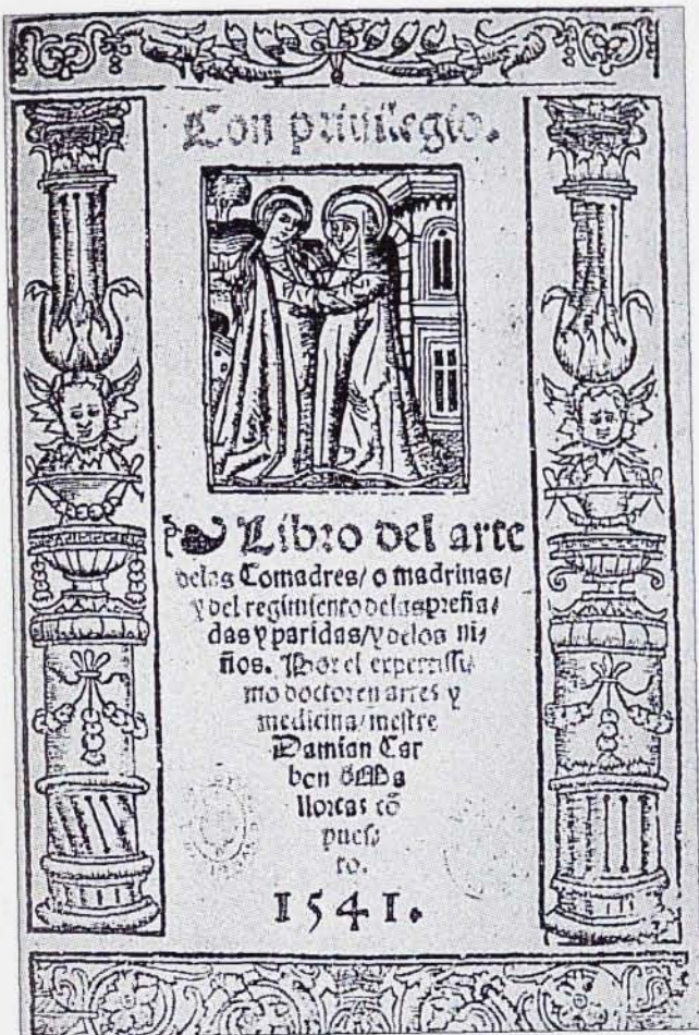
El Libro del arte de las Comadres de Damià Carbó, 1541