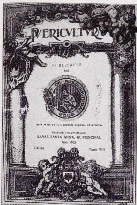
«Puericultura» d'Alexandre Frias.