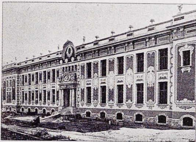
Un dels pavellons de la Casa de Maternitat de Les Corts, de l'arquitecte Camil Oliveras i Gensana.