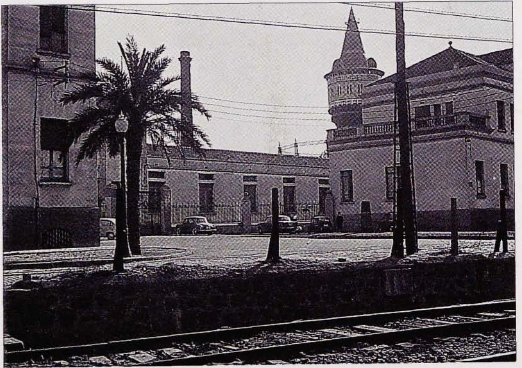
L'Hospital d'Infecciosos, un emplaçament poc afortunat.