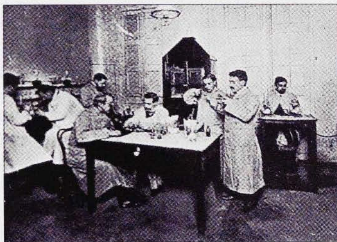
Laboratori de Bacteriologia de l'Acadèmia i Laboratori de Ciències Mèdiques, creat el 1897.