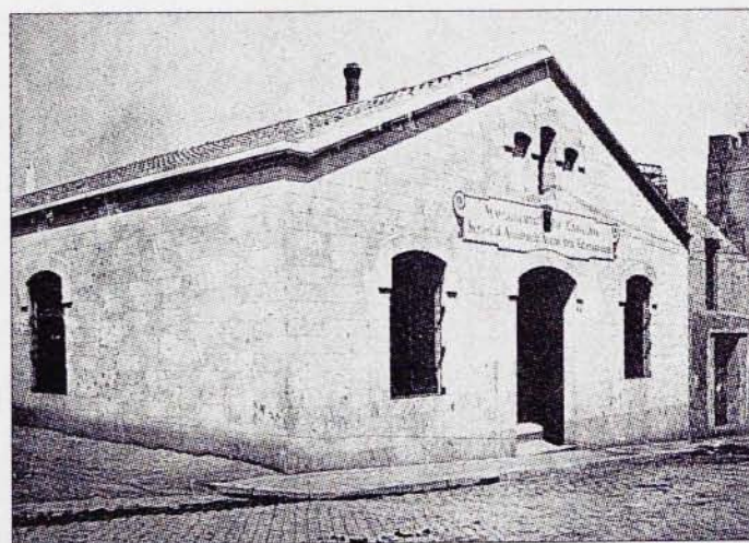
Dispensari del carrer de Rades, del Servei d'Assistència Social dels Tuberculosos, de la Mancomunitat, obert el 1921.